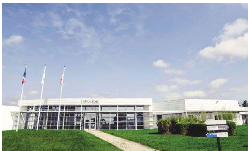
Source plans : Communauté de communes Caux-Austreberthe Source photo : industrie Lucibel