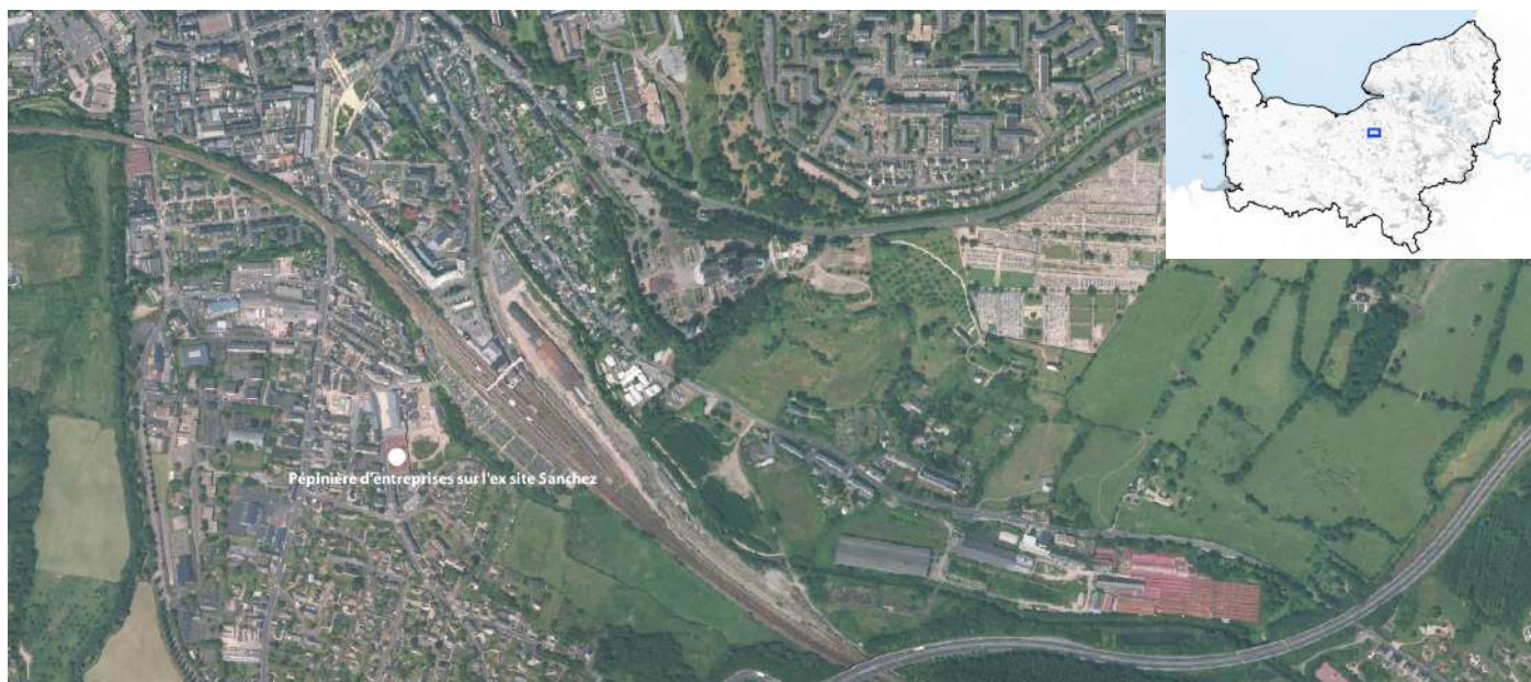
Pépinière d'entreprises sur l'ex site Sanchez

Communauté d'agglomération Lisieux Normandie